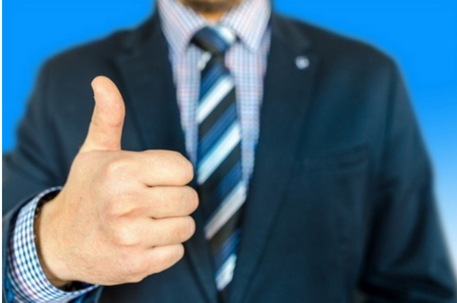
Vorteile durch Wirtschaftsberatung nutzen