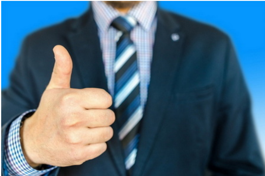
Vorteile durch Wirtschaftsberatung nutzen